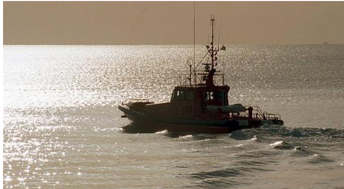
Los barcos de Salvamento Marítimo participaron en la búsqueda del helicóptero

Una vez pasadas las cuatro horas de autonomía y sin que se hubieran recibido comunicaciones desde la aeronave, se dio la voz de alarma. Se dio aviso a los aeropuertos de Málaga y Melilla que confirmaron que el helicóptero no había aterrizado en ninguno de ellos. De esta manera dio comienzo el dispositivo de búsqueda del aparato y sus tripulantes. Embarcaciones de la Armada, Vigilancia Aduanera, Guardia Civil e incluso pesqueros de la zona participaron en la búsqueda.