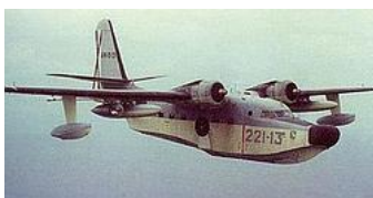
Avión Grumman-Albatros- EJÉRCITO DEL AIRE

El triángulo de las Bermudas es famoso por ser el protagonista de historias de desapariciones misteriosas de navíos y aeronaves y de actividades extrañas en los radares de aviones y barcos. Pero no es este el único triángulo misterioso que existe en el planeta Tierra. Según el especialista en ufología Antonio Ribera en total habría doce triángulos . Cinco sobre el paralelo 36 latitud Norte (Bermudas, Alborán, Afganistán, del Diablo e islas Aleutianas). Otros cinco sobre el paralelo 36 latitud Sur (Argentina-Patagonia, costa oriental de África, Índico, entre Nueva Zelanda y Australia y al sur de la isla de Pascua). Las dos últimas zonas sería los polos.